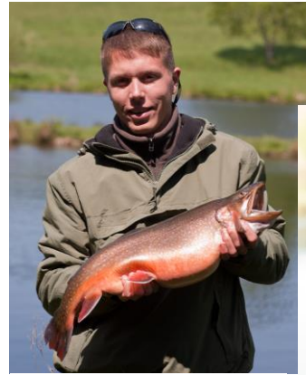
oben: Bild aus der Saiblingszucht 4,6 kg rechts: 5-jährige Regenbogenforelle 5,3 kg

Unbestechlich ist die Fischqualität durch das klare Trauntalwasser, die Futterqualität und das naturnahe Füttern und Aufziehen unserer Forellen.